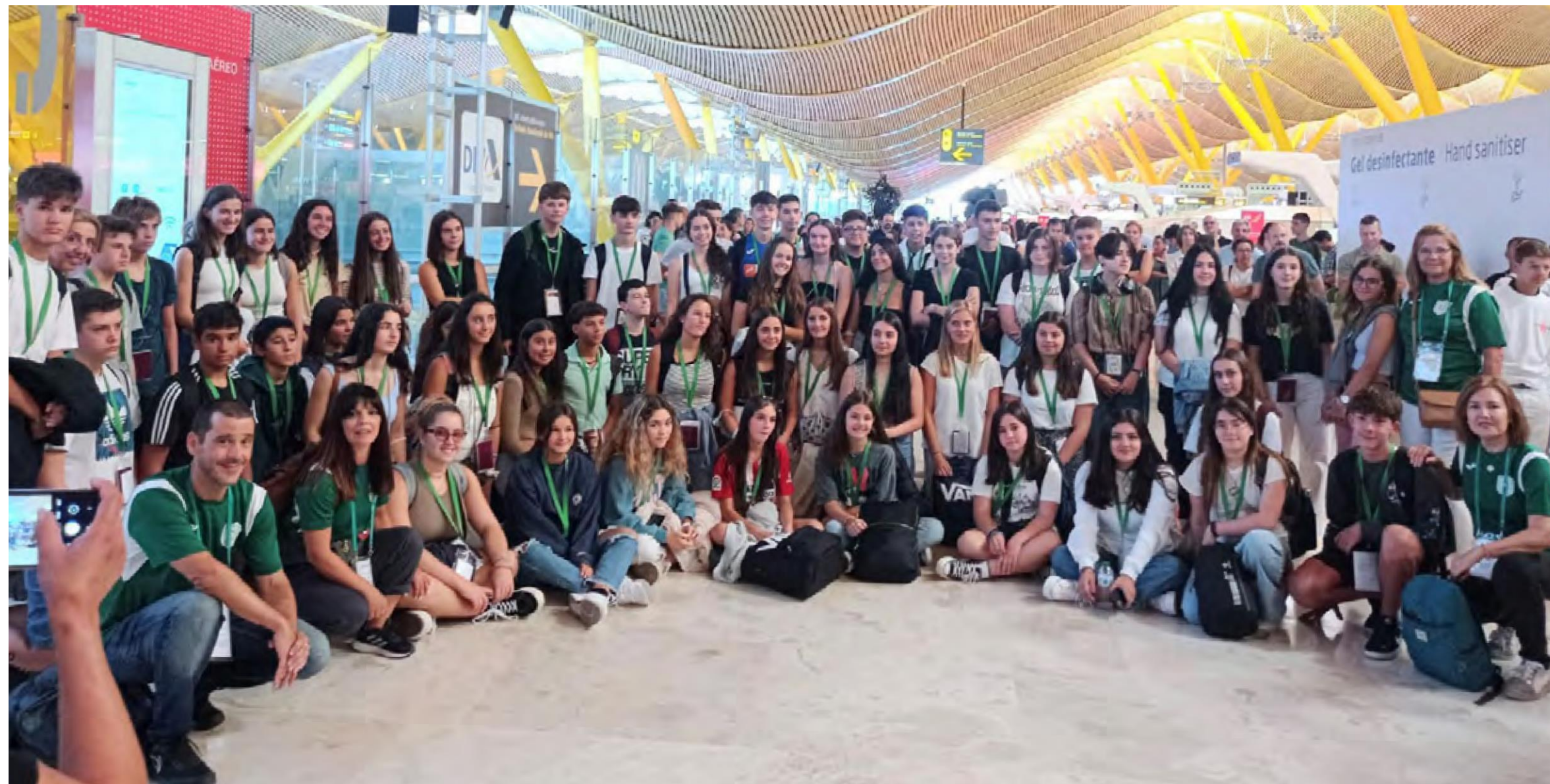
Estudiantes del programa Año escolar en Irlanda en el Aeropuerto Adolfo Suárez Madrid-Barajas.