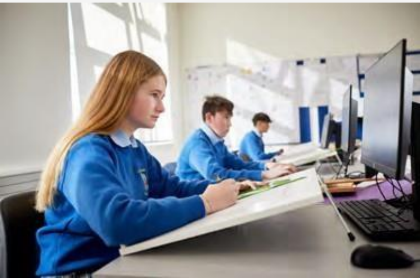
Colegio público “Colaiste Chiarain”, Athlone.