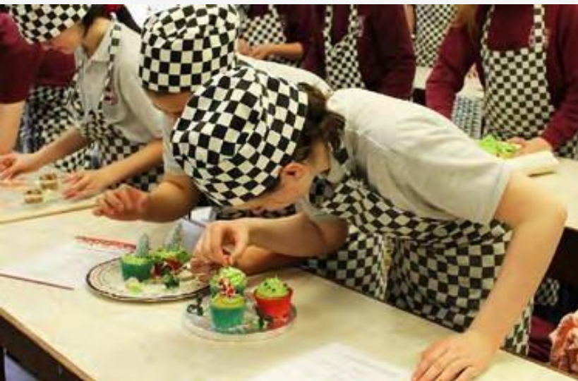
Colegio público “Schull Community”, Cork.