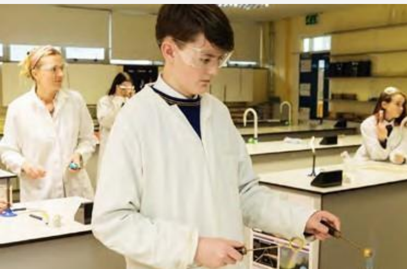
Colegio público “St. Laurence College”, Dublin.