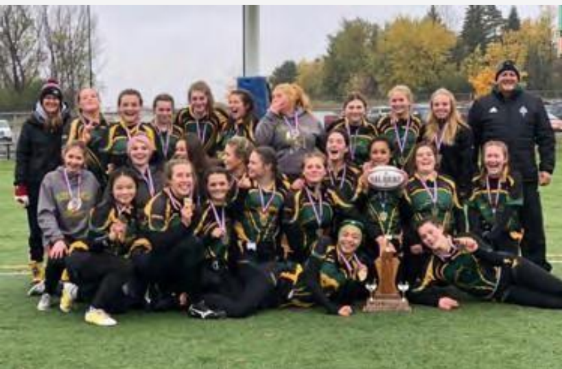
Equipo femenino de rugby de "Centennial School".