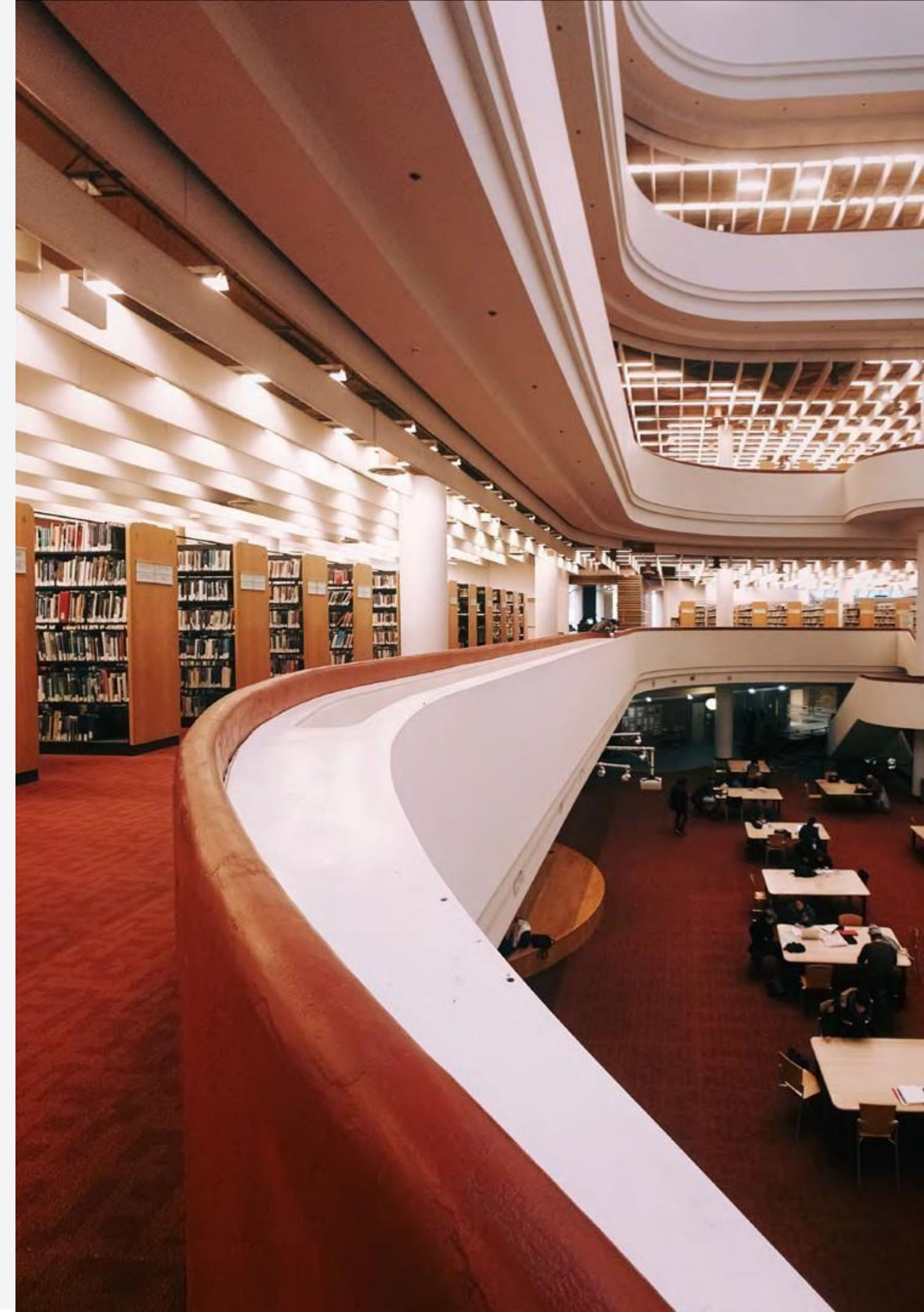
Biblioteca pública en Yonge Street, Toronto, Ontario, Canadá.

Libros incluidos no llevan uniforme escolar