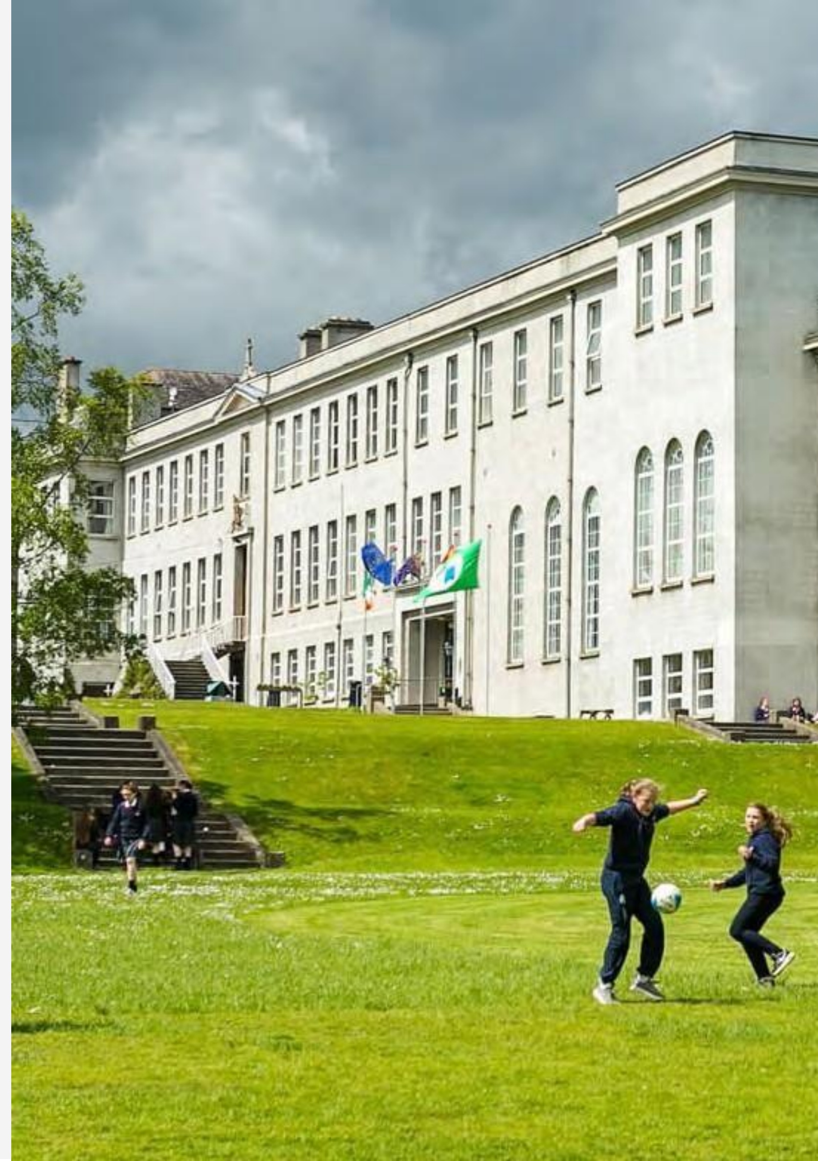
Colegio público St Mary's College, Arklow, Wicklow.