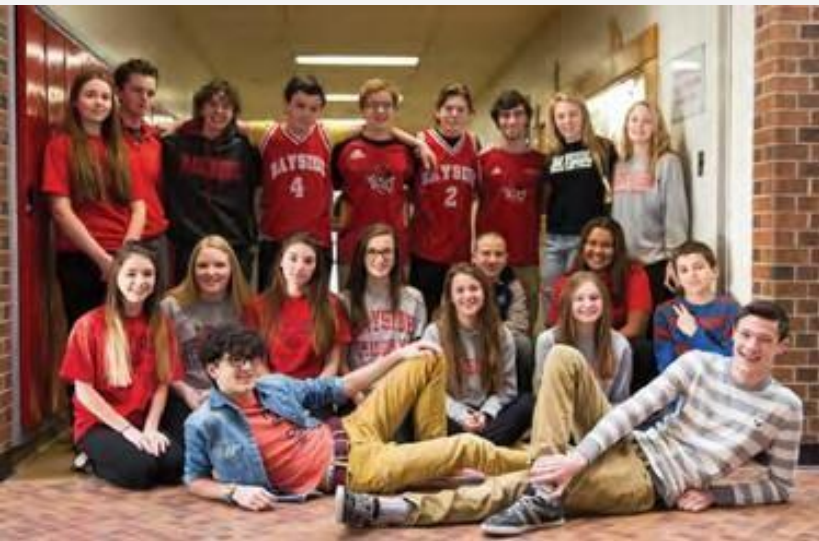
Estudiantes de "Bayside Secondary School".