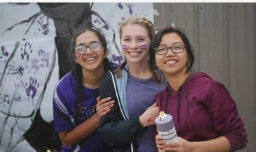
Estudiantes de "Eastside Secondary School".